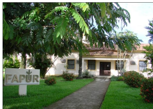
FIGURA 1 SEDE DA FAPUR