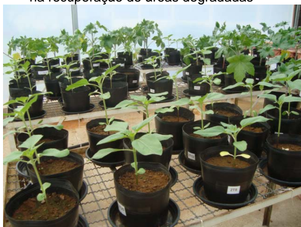
Figura 11 Experimento de Casa de vegetação. Mamona em solo contaminado com petróleo e adubada com doses crescentes de torta de mamona do processo de produção direto da semente (PDS). Seropédica - RJ

Objeto: Potencial de aplicação da torta de mamona na agricultura, na remediação de áreas impactadas e na recuperação de áreas degradadas