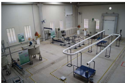
FIGURA 5 VISTA INTERNA DO LABORATÓRIO