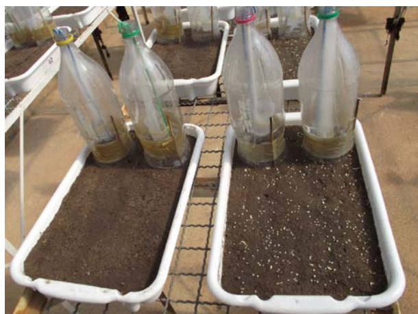
FIGURA 7 ESTUDOS VOLATILIZAÇÃO DE N DAS MISTURAS PASTILHADAS DE UREIA COM DIFERENTES FONTES DE ENXOFRE. 2010-2012.

Objeto: Execução, pela UNIVERSIDADE, sob regime de preço total, para o estudo "Uso de Micronutrientes e Enxofre no Aumento da Eficiência de N-Ureia", de conformidade com os termos e condições nele estipulados e no Anexo I - Proposta da FUNDAÇÃO s/nº, datada de Julho/2010.