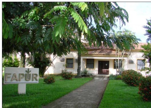
FIGURA 1 SEDE DA FAPUR

Promover a pesquisa; Colaborar com instituições de ensino, pesquisa e extensão do país e do exterior no preparo, na execução e avaliação de programas de ensino, pesquisa e atividades culturais; Exercer atividades científicas e culturais; Celebrar contratos acordos ou convênios com instituições e empresas públicas e privadas, visando através de cooperação técnica ou financeira, apoiar, fortalecer ou ampliar os serviços dessas instituições e a utilizá-las em conjunção com os programas em execução; Atuar junto a instituições e ou organizações públicas ou privadas e entidades não governamentais, desde que vinculadas a projetos de ensino, pesquisa e extensão, prestação de serviços e produção; Conceder bolsas de estudo, em nível de apoio técnico, graduação e pós-graduação; Promover o intercâmbio de pesquisadores nacionais e estrangeiros, através de concessão ou complementação de bolsas de estudo ou pesquisas, no país ou no exterior; Promover ou subvencionar a publicação de livros, apostilas e informes técnicos; Servir de centro de documentação para sistematizar e divulgar conhecimentos técnicos; Instituir e conferir prêmio para trabalhos de natureza científica que contribuam para o desenvolvimento técnico cultural da comunidade; Promover cursos de especialização, extensão, simpósios, seminários e conferências.