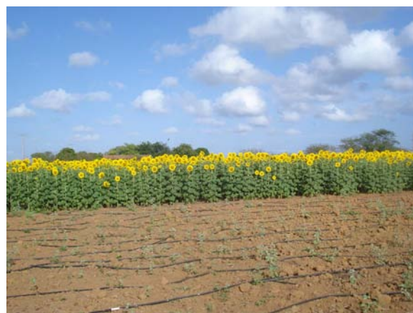
FIGURA 10 EXPERIMENTO DE CAMPO. PRIMEIRO PLANO, EXPERIMENTO COM MAMONA, RECÉM-IMPLANTADO E EM SEGUNDO PLANO O GIRASSOL. AMBOS COM DOSES CRESCENTES DE TORTA DE MAMONA DO PROCESSO DE PRODUÇÃO DIRETO DA SEMENTE (PDS). MOSSORO - RN.