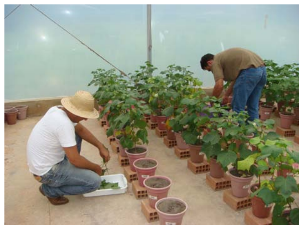
FIGURA 6 COLETA DO EXPERIMENTO EM CASA DE VEGETAÇÃO DO ALGODÃO. 2011.