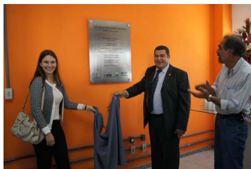
FIGURA 2 INAUGURAÇÃO DO LABORATÓRIO