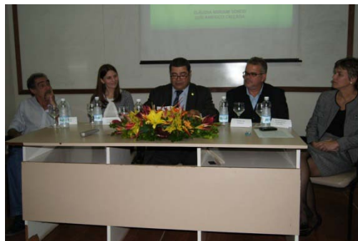
FIGURA 4 INAUGURAÇÃO DO LABORATÓRIO