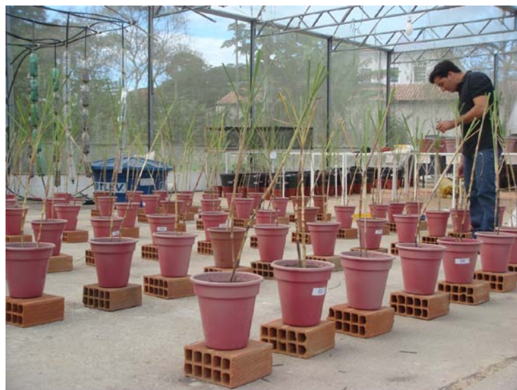
FIGURA 9 EXPERIMENTO EM CASA DE VEGETAÇÃO COM CANA DE AÇUCA. 2011.