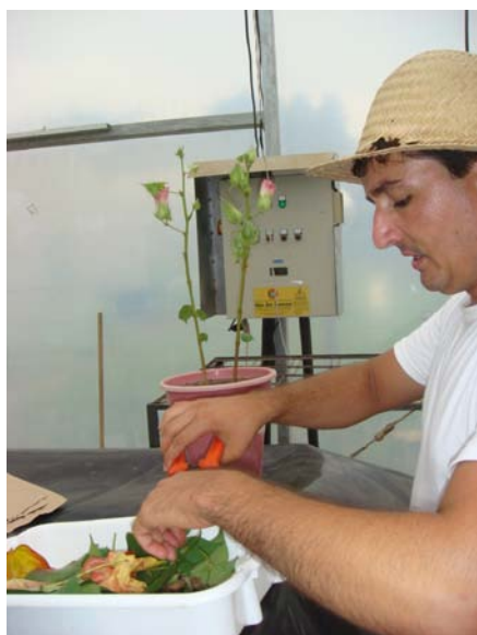
FIGURA 8 COLETA DOS PARÂMETROS DO ALGODÃO DO EXPERIMENTO DE ESTUDOS DA EFICIÊNCIA DE USO DE MISTURAS PASTILHADAS DE UREIA COM MICRONUTRIENTES. 2011.