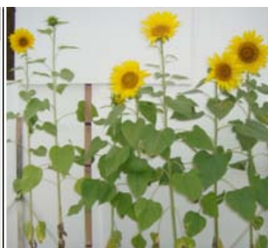
0 NPK 5 10 20 40 80 PDS tratada (B)