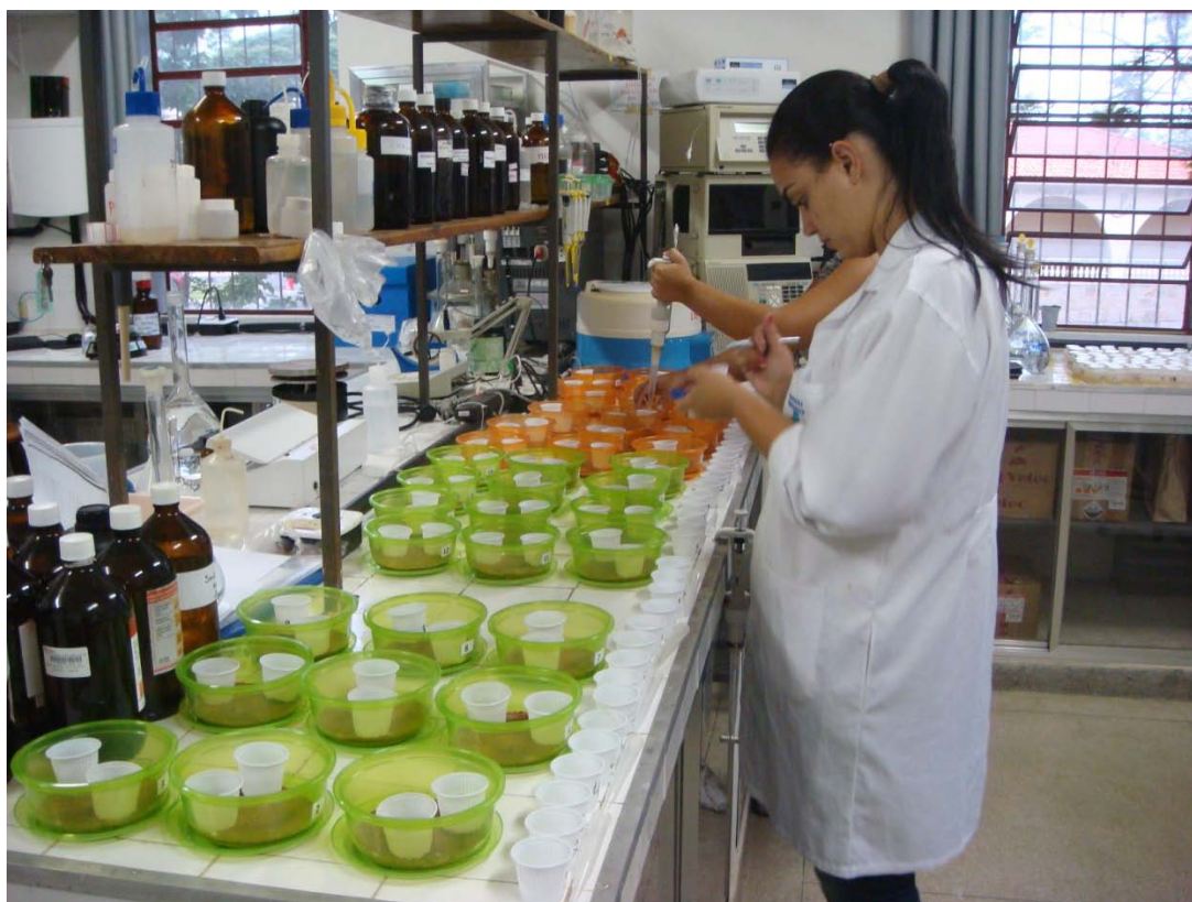
Figura 14 Experimento de laboratório. Montagem dos ensaios de respirometria para avaliação da atividade microbiana através da evolução de CO 2 . Foram usados cascalho de perfuração e torta de PDS.