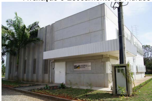
FIGURA 3 VISTA EXTERNA DO LABORATÓRIO

Objeto: Desenvolvimento do projeto intitulado " Implementação na UFRRJ de um Laboratório de Preparo, Avaliação e Escoamento de Fluidos"