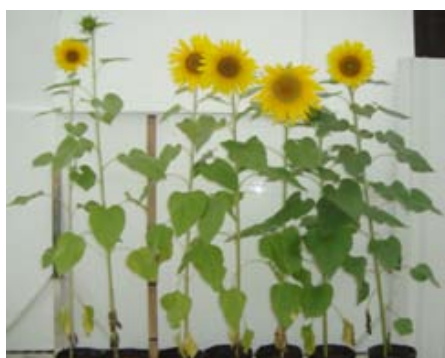
0 NPK 5 10 20 40 80 PDS "in natura" (A)