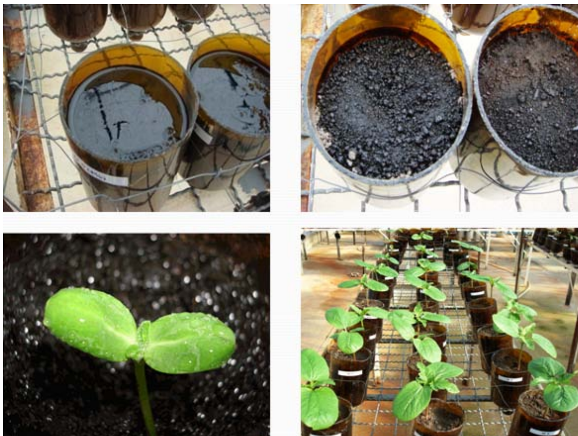
FIGURA 13 EXPERIMENTO NA CASA DE VEGETAÇÃO DA UFRRJ COM SOLO CONTAMINADO COM HIDROCARBONETOS DE PETRÓLEO, USANDO COMO PLANTA INDICADORA O GIRASSOL, ONDE FORAM ADICIONADAS DOSES CRESCENTES DE TORTA DE MAMONA DO PROCESSO PDS.