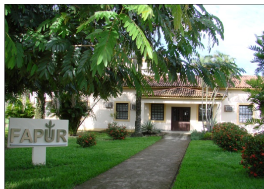
FIGURA 1 SEDE DA FAPUR

técnica ou financeira, apoiar, fortalecer ou ampliar os serviços dessas instituições e a utilizá-las em conjunção com os programas em execução;