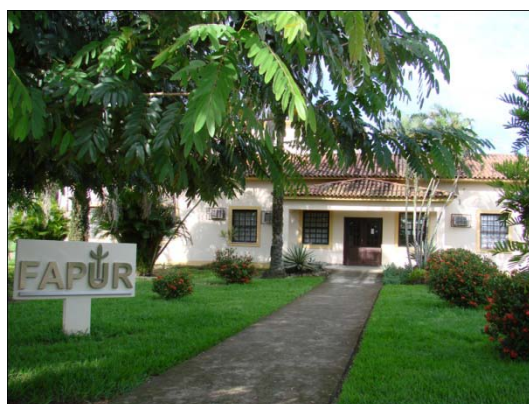
FIGURA 1 SEDE DA FAPUR

A Fundação de Apoio à Pesquisa Científica e Tecnológica da Universidade Federal Rural do Rio de Janeiro – FAPUR foi instituída pelo Conselho da Universidade Federal Rural do Rio de Janeiro, por decisão tomada em 03 de julho de 1996, Deliberação nº. 17 e processo nº. 18.120/96/MP da Provedoria de Fundações da Procuradoria Geral da Justiça do Estado do Rio de Janeiro, com personalidade jurídica de direito privado, sem fins lucrativos, com autonomia patrimonial, administrativa e financeira.