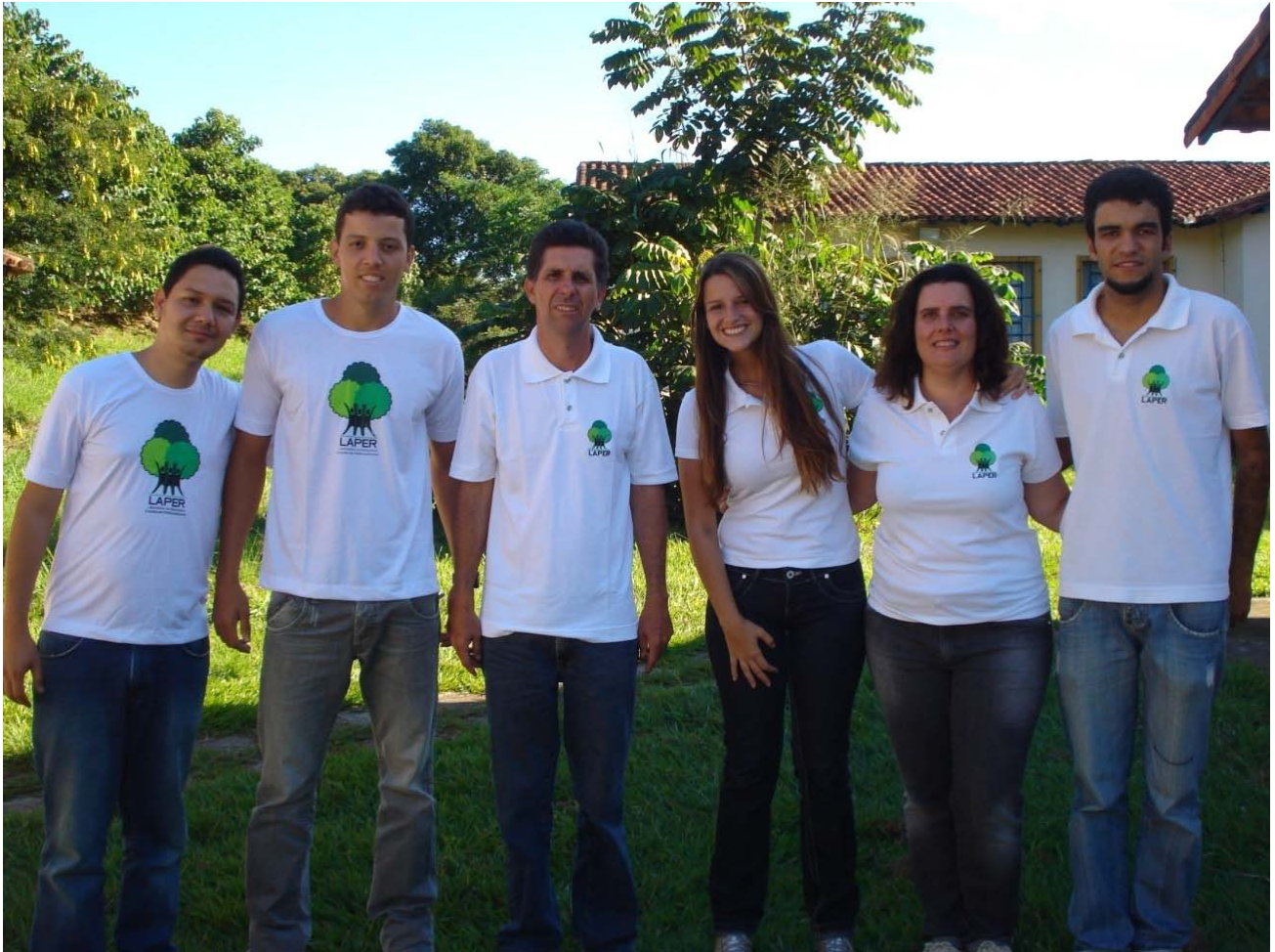
FIGURA 7 EQUIPE DA UFRRJ