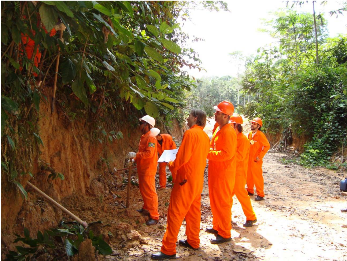
FIGURA 8 EQUIPE DE PEDAGOGIA DESCREVENDO SOLOS NA PROVÍNCIA PETROLÍFERA DE URUCU - COARI/MANAUS