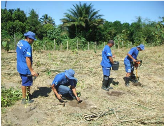
FIGURA 5 PLANTIO