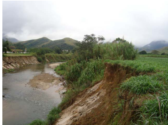
FIGURA 2 DESBARRANCAMENTO RIO MACACU