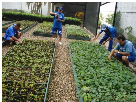
FIGURA 6 PRODUÇÃO DE MUDAS - CASA DE SOMBRA