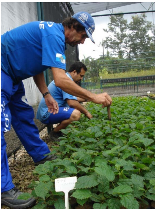
FIGURA 3 PRODUÇÃO DE MUDAS - CASA DE SOMBRA