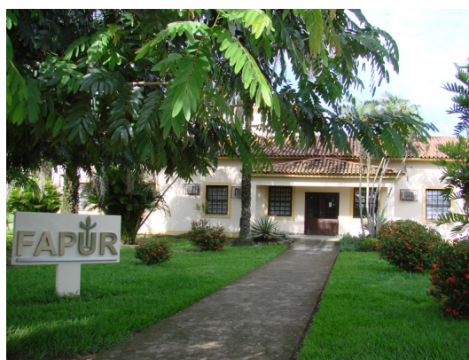
FIGURA 1 SEDE DA FAPUR

A Fundação de Apoio à Pesquisa Científica e Tecnológica da Universidade Federal Rural do Rio de Janeiro – FAPUR foi instituída pelo Conselho da Universidade Federal Rural do Rio de Janeiro, por decisão tomada em 03 de julho de 1996, Deliberação nº. 17 e processo nº. 18.120/96/MP da Provedoria de Fundações da Procuradoria Geral da Justiça do Estado do Rio de Janeiro, com personalidade jurídica de direito privado, sem fins lucrativos, com autonomia patrimonial, administrativa e financeira.