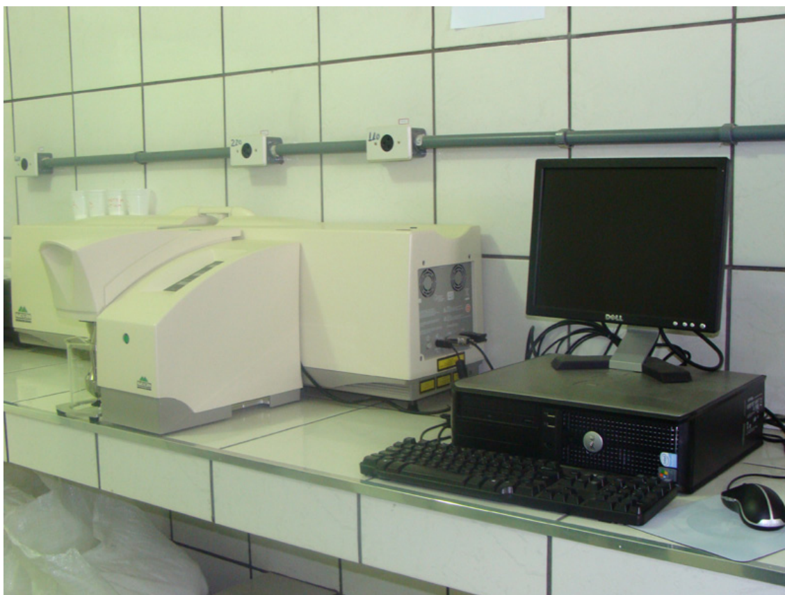
FIGURA 5 REFORMA DO LABORATÓRIO DE ENGENHARIA QUÍMICA