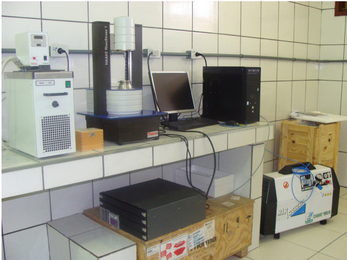
FIGURA 8 REFORMA DO LABORATÓRIO DE ENGENHARIA QUÍMICA