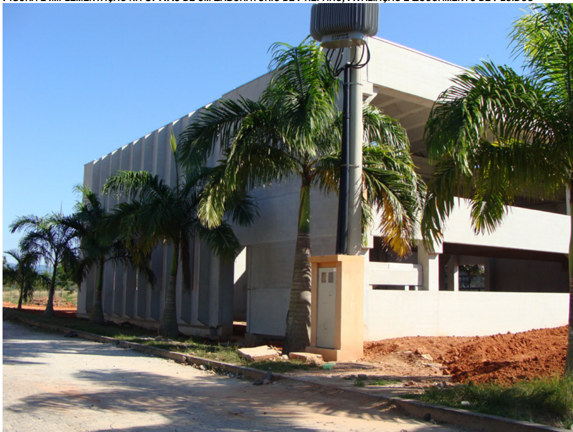
FIGURA 3 IMPLEMENTAÇÃO NA UFRRJ DE UM LABORATÓRIO DE PREPARO, AVALIAÇÃO E ESCOAMENTO DE FLUÍDOS