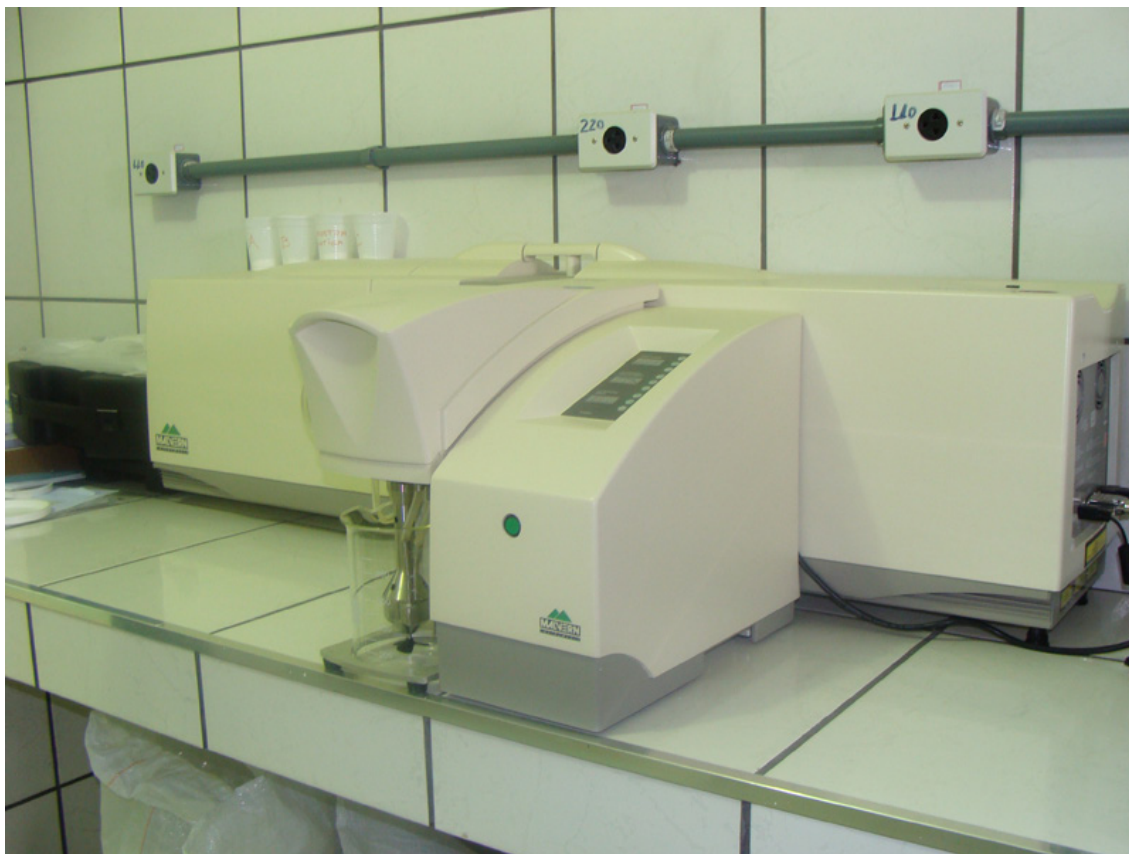
FIGURA 4 REFORMA DO LABORATÓRIO DE ENGENHARIA QUÍMICA