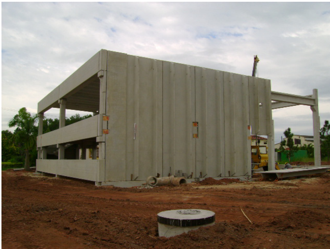
FIGURA 2 IMPLEMENTAÇÃO NA UFRRJ DE UM LABORATÓRIO DE PREPARO, AVALIAÇÃO E ESCOAMENTO DE FLUÍDOS