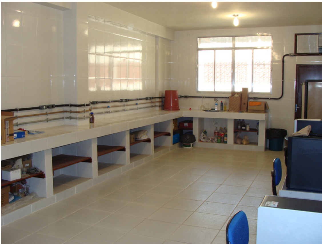
FIGURA 7 REFORMA DO LABORATÓRIO DE ENGENHARIA QUÍMICA