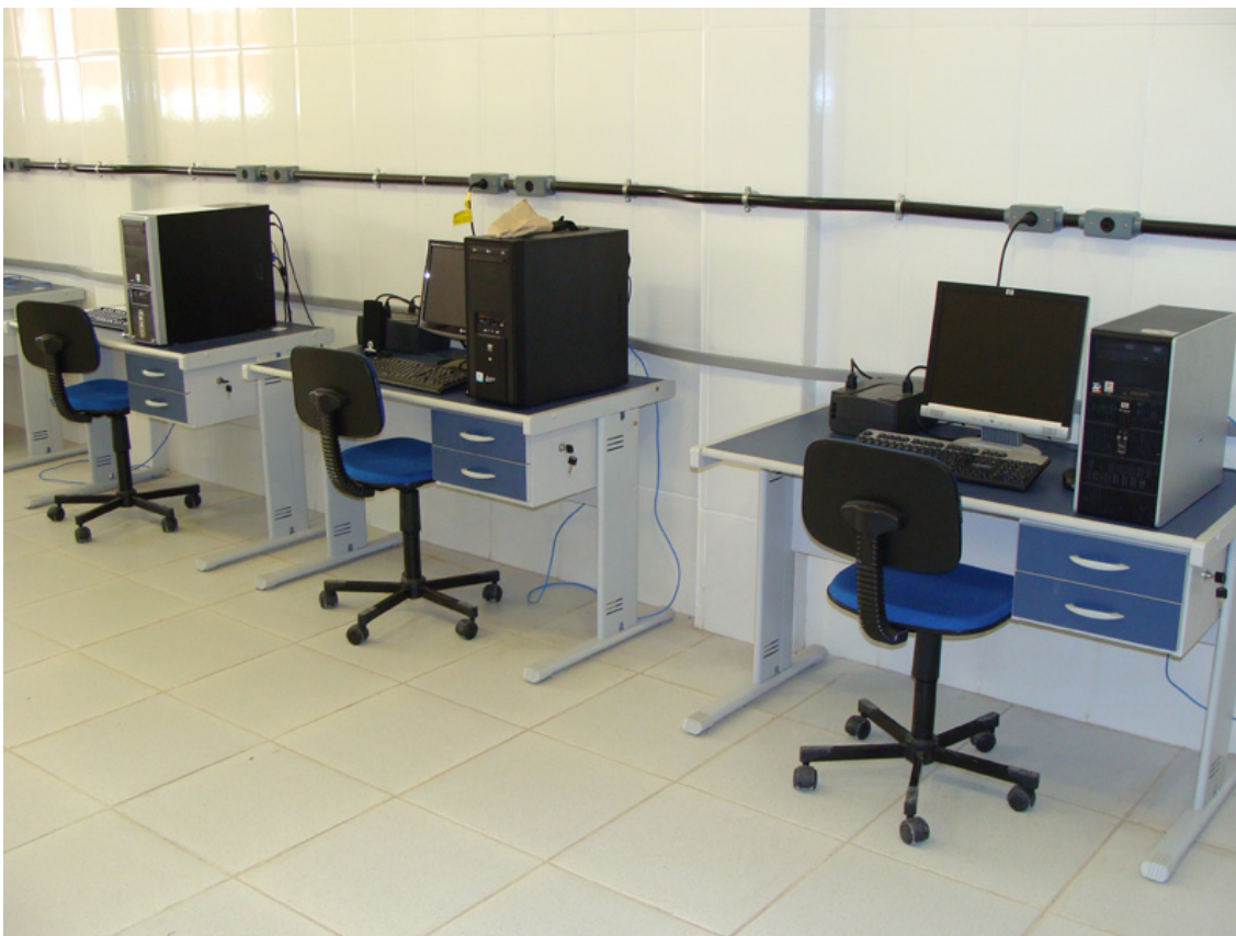
FIGURA 6 REFORMA DO LABORATÓRIO DE ENGENHARIA QUÍMICA