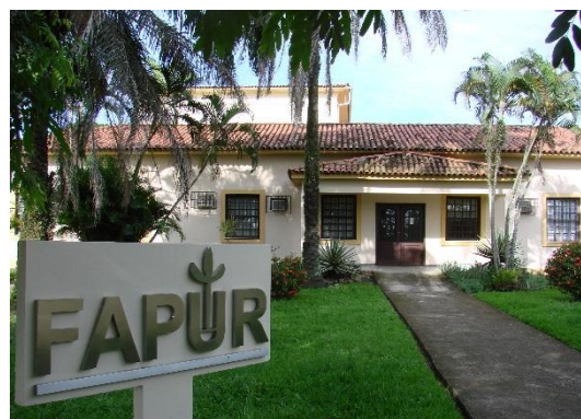
FIGURA 1 SEDE DA FAPUR